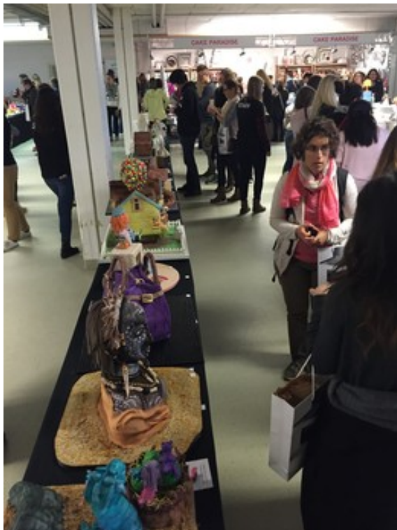
Zuckerguss so weit das Auge reicht

Medienart: Internet Medientyp: Tages- und Wochenpresse UUpM: 542'000 Page Visits: 3'612'246